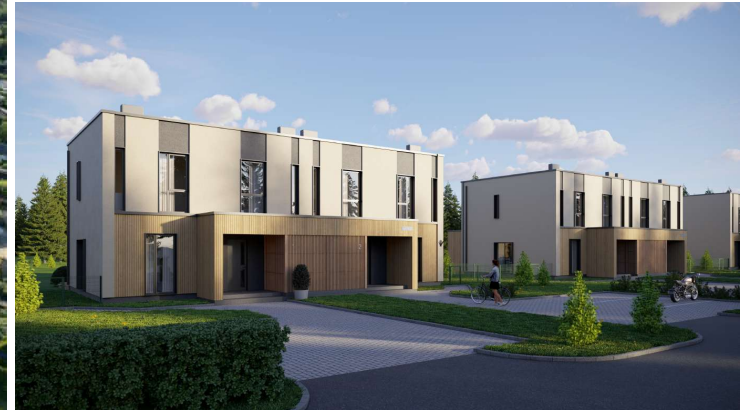
3D VISUALISEERINGUD. KÕIK PILDID ON ILLUSTRATIIVSED JA VÕIVAD SISALDADA EBATÄPSUSEID.