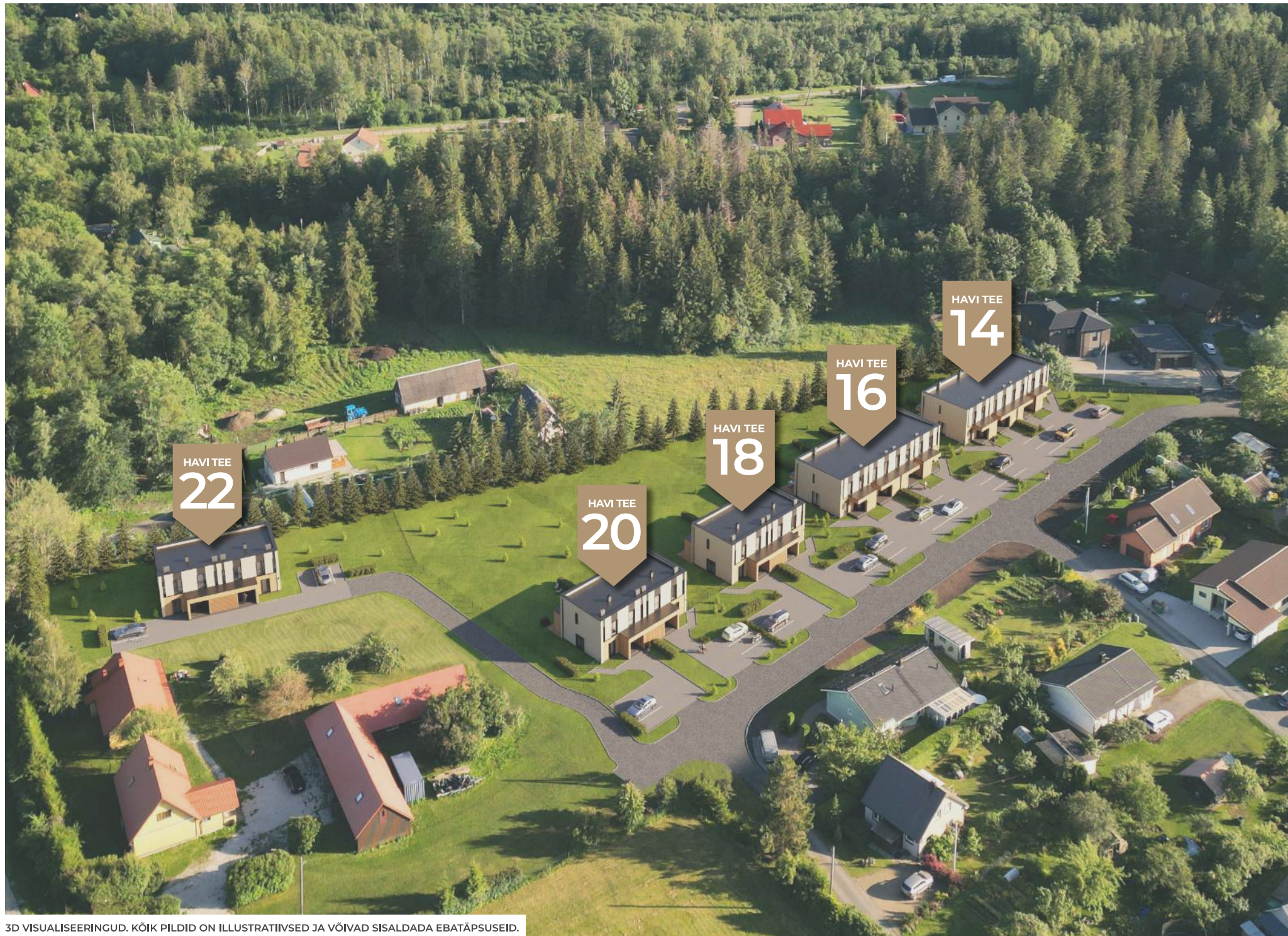
3D VISUALISEERINGUD. KÕIK PILDID ON ILLUSTRATIIVSED JA VÕIVAD SISALDADA EBATÄPSUSEID.