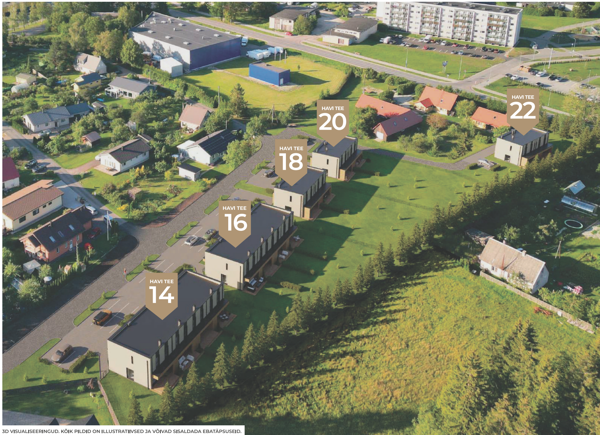
3D VISUALISEERINGUD. KÕIK PILDID ON ILLUSTRATIIVSED JA VÕIVAD SISALDADA EBATÄPSEID.